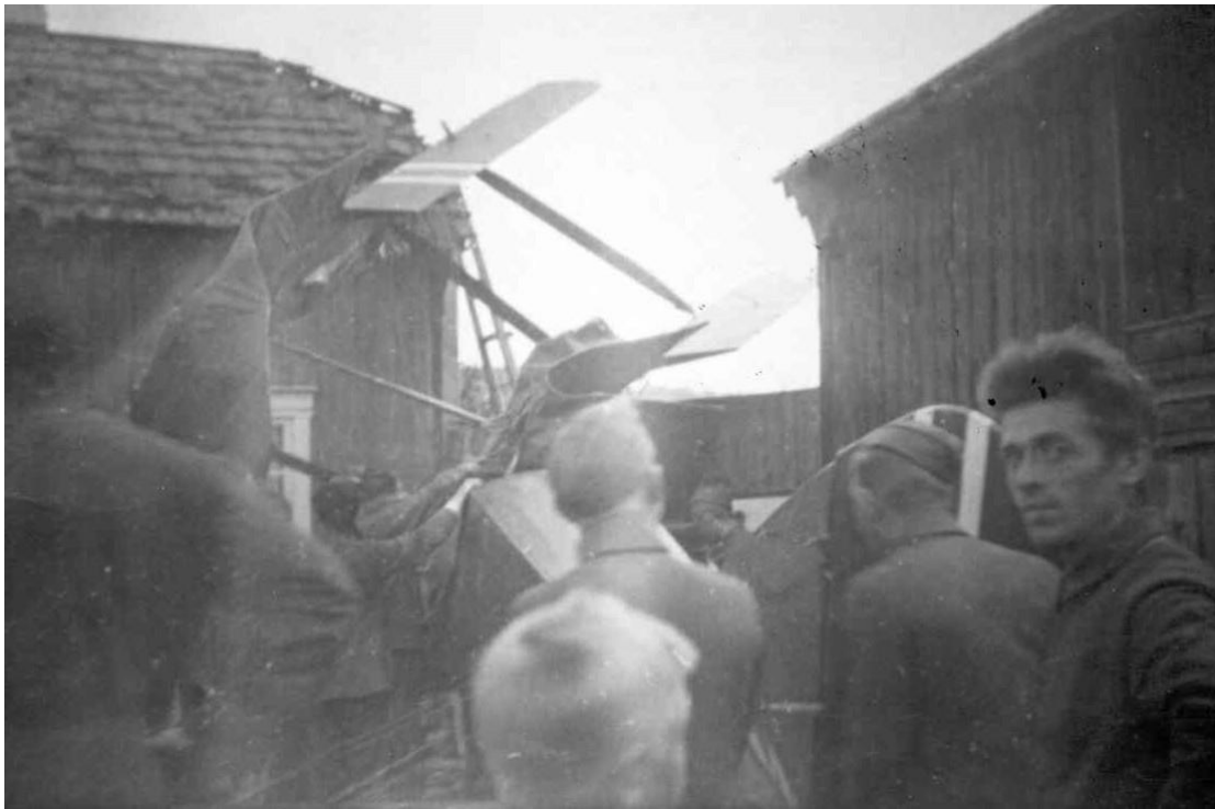
Flyhavariet på Værnesbranden, mandag 17. juli 1922