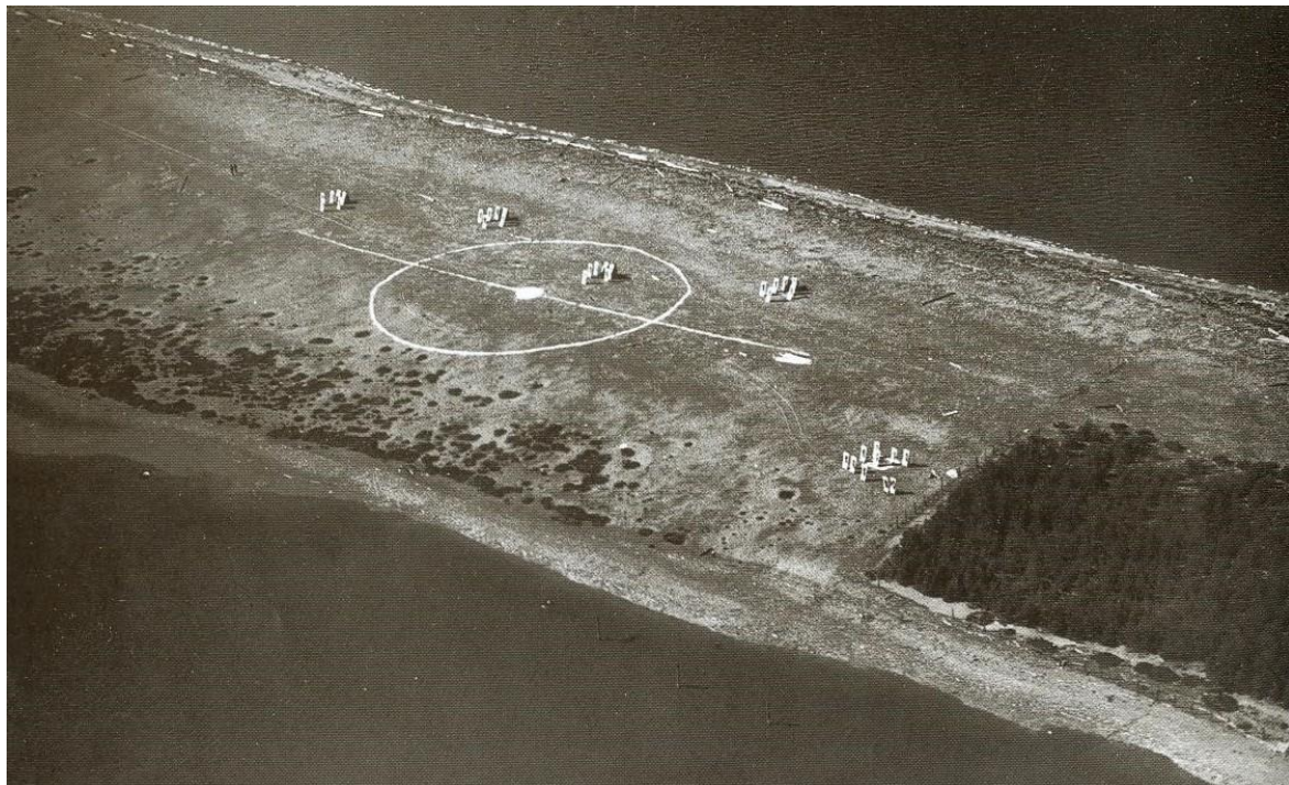
Langøra på Stjørdal, i sin tid både badeplass og bombemål for fly fra Værnes

men mye samfunnskunnskap. Lite visste hun der hun snudde seg og sjekket ungene at hun selv ikke skulle bli så gammel, og en ny enkemann ville sitte tilbake med fem barn. Jo, de få ettermiddagene familien kunne unne seg en tur utpå Langøra var verdifull rekreasjon.