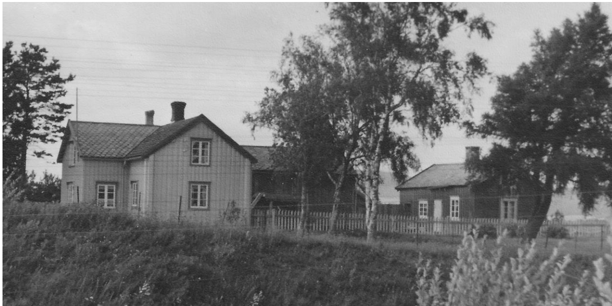
Værnesbranden (Gr.nr 107, br.nr 104)

Ungene likte seg så godt der på sandstranden. Svømming var ikke målet, kun litt bading. Det var ikke så mange som kunne svømme. Men det å sette sitt avtrykk, for ikke å si fottrykk, var spennende, og hun fikk fortelle sin favoritthistorie om Robinson Crusoe, av Daniel Defoe, som var spion for dronning Anne i England. Ungene frydet seg når de så et fotavtrykk i sanden, og spilte med. Den siste tiden hadde hun blitt klar over en annen bok, som het Tarzan, hvis historie hadde en viss parallell i utgangspunktet. I det tanken flyr forbi kom hun tilbake til hvorvidt de burde anspore ungene til å lære å svømme. Mannen var fast bidragsyter i Stjørdalens Blad, med en serie han kalte: «Fra svunnen tid». Derfor ble det til at hun fulgte med i Bladet, og hadde nylig blitt klar over at en amerikaner hadde blitt det første menneske til å svømme 100 meter på under ett minutt. Det hendte den 9. juli, bare for noen dager siden. Hun skjønnte selvsagt ikke hvor fort det var, eller hvilken prestasjon det var, så tankene skiftet tema. Hadde hun kunne se inn i fremtiden, ville hun visst at denne amerikaneren skulle bli verdens beste svømmer, med fem OL-gull - og i tillegg bli en av verdens meste kjente skuespillere, nettopp i de kommende filmene om Tarzan. Her kunne tankespor ha krysset på nytt. Hans navn var Johnny Weissmuller. Men det kunne nok i og for seg være det samme, fordi hun ville trolig ikke synes så meget om hans noe svevende liv. Han ble gift og skilt fem ganger.