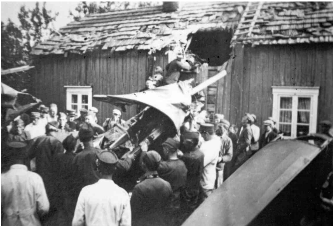
Motoren forsvant gjennom taket