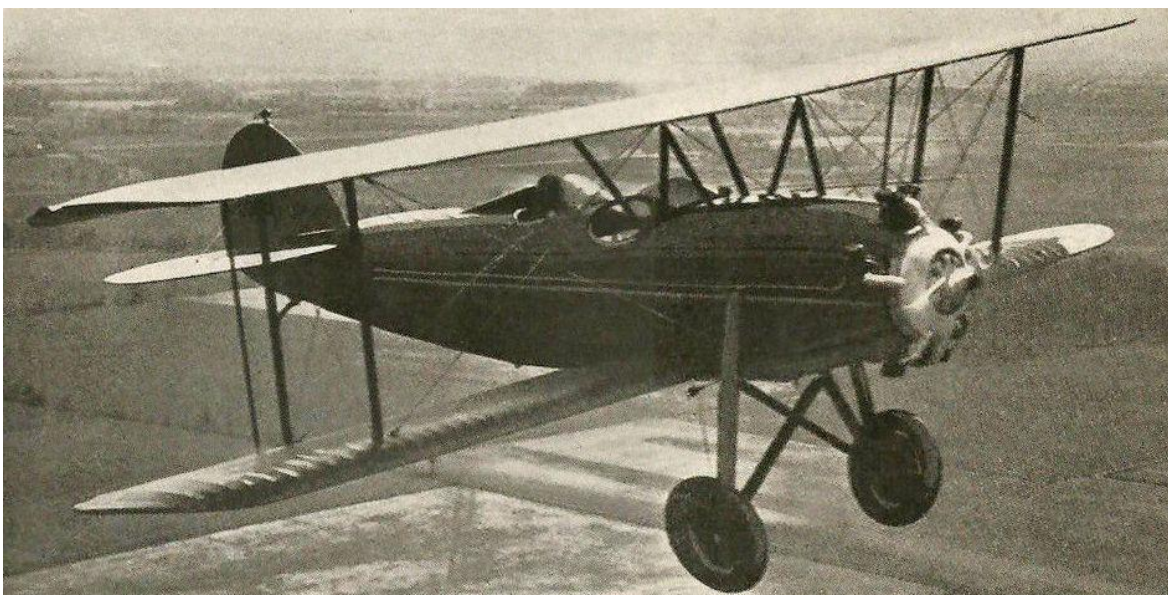
Type fly som Henry Dahlen kjøpte seg