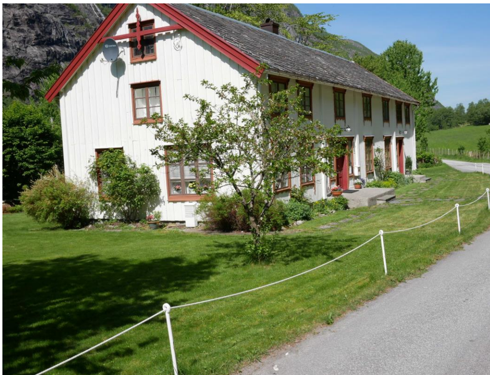
Dalen gård i Sunndal