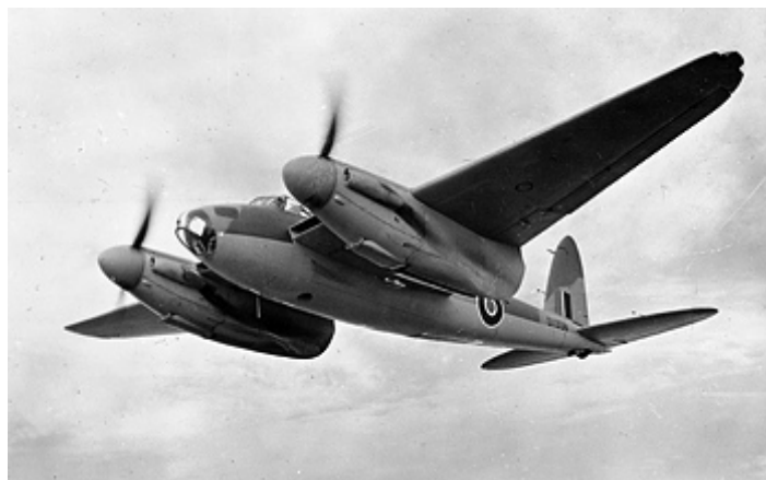
Tomotor Mosquito jagerbomber på vei mot Shellhuset. Vingerammer og skrog var bygget hovedsakelig av tre, noe som gjorde flyet ekstra sårbar med tanke på treff fra luftvern.