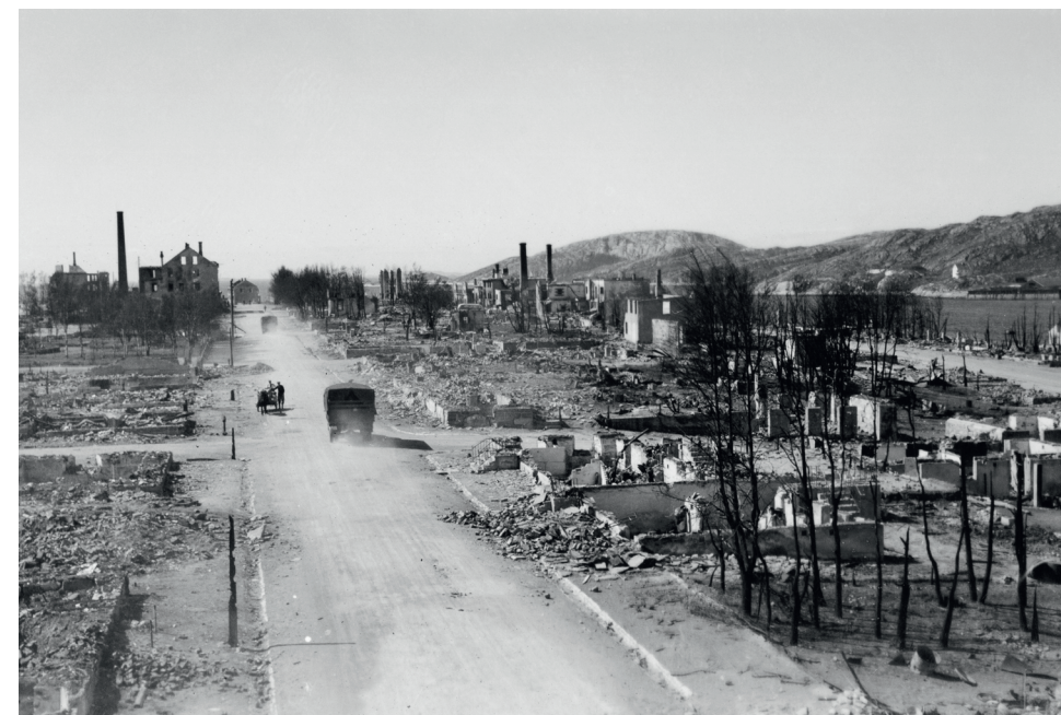
Storparten av Bodø vart verande eit ørkenlandskap etter bombenes fall. Berre nokre enkle piper stod att etter brannen, som meieriet sine i bakgrunnen til venstre. Gatemønstreret og infrastrukturen under bakken vart likevel vidareført som før. Slik vart det kontinuitet i byplanlegginga og kommunen sparte pengar.

Det er derfor naturleg å stille to spørsmål ved arbeidet til BSR i Bodø. For det