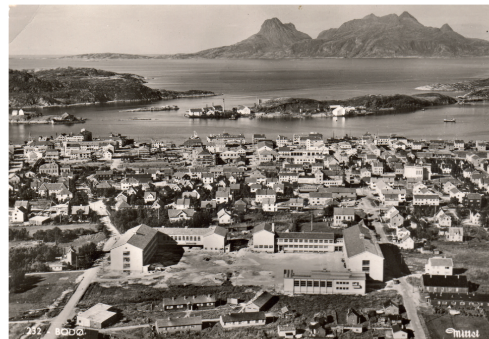
Bodø, 1951. Byen vart framtidretta og moderne. I framgrunnen «en av det nordlige Europas vakreste og nyttigste skoler». I bakgrunnen eit nytt bysentrum i emning, arkitektonisk sett nokså likt det ein elles såg i gjenreisingsbyar som Steinkjer, Kristiansund og Vadsø. Dette vart alle byar som utstrålte den sosialdemokratiske velferds- og likskapstanken i etterkrigstidas Noreg.

Eit anna poeng som riv ned kritikken som vart ført mot Bodøs gjenreisingsplan og BSR, heng saman med planarbeidets endelikt under krigen. Det vart nemleg lagt i møllposen under okkupasjonen. Tyske styresmakter hindra sivil oppbygging, fordi stadig større delar av det nedbrente