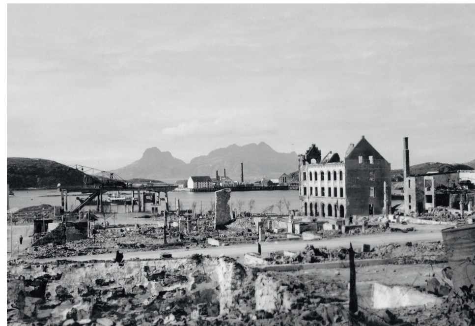
Bodø sentrum var stort sett utsletta etter bomberegnet 27. mai 1940. Det kom ikkje opp igjen før mot slutten av 1940-åra, og i mellomtida skulle folk leve gjennom ein krig i eit ruinlandskap.

verke over sommaren 1940. På den tida tok dei hand om gjenoppbygginga. Dei organiserte dessutan gjenreisingsorgan som Gjenreisningsavdelinga i Justisdepartementet , Brente Steders Regulering (BSR) , Krigsskadetrygden , Krigsskadetrygdens gjenreisningsnemnd og Distriktsarkitektene . 5