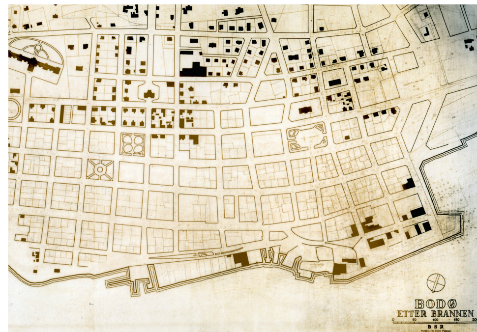
Kart som viser det som vart borte etter brannen 27. mai 1940.

Bodø vart likevel ikkje urørt av Reichskommissariat Joseph Terbovens politiske og administrative innstramming av det