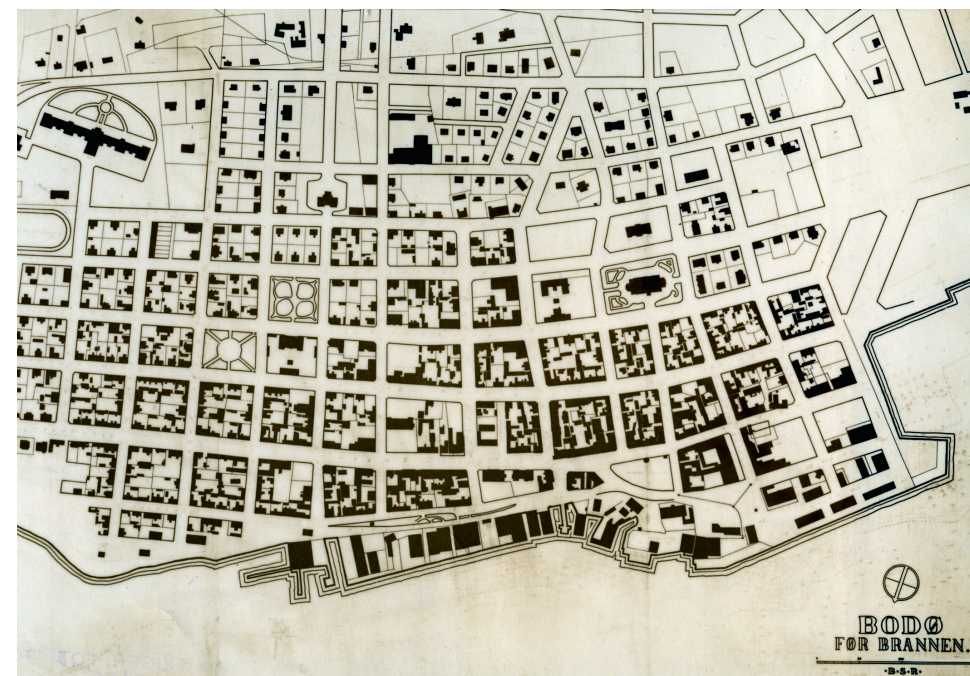
Kart over gamle Bodø sentrum før brannen 27. mai 1940.

Byplanfeltet var under rivande utvikling internasjonalt på 1920- og 30-talet. Både Sovjetunionen og Italia gjekk føre med skaping av mønsterbyar som skulle spegle dei nye ideologiane der. Eksempel frå Magnetogorsk (Sovjetunionen), og nye italienske byar som Littoria (1932), Pontinia (1933), Sabaudia (1934), Aprilia (1937) og Pomezia (1937) syner slike sterkt ideologiske og politiske prosjekt. Samstundes visar desse italienske by-