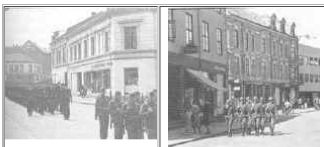
Soldater marsjerer gjennom byen.

Noen uker etter tror jeg det var, snakket de voksne om at det skulle komme et stort, tysk marineorkester til Horten og holde konsert på torget. Dette var visst et veldig kjent orkester, og folk var enige om at de måtte møte frem og høre på det, – krig eller ikke. Dagen kom, torvet var så vidt jeg kan huske stappende fullt av folk. De tyske marinefolkene kom reisende i busser. De stilte opp notestativene sine på torvet, dirigenten inntok sin plass, og så holdt de konserten. Og de fikk full applaus. Denne hendelsen har jeg ikke hørt at noen har snakket om siden. For meg som seksåring virket det som stemningen var falt mer til ro, vi glemte nesten krigen for noen dager. Livet lot til å komme mer over i sin normale gang.