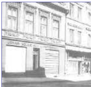
Tildekkede vinduer hos Johan Sollie Bok og Papirhandel

Noe som skjedde, visstnok i 1941 eller 1942, var at det kom et dekrét fra Quislings regjering om at alle barn og unge over en viss alder skulle være med om høsten og plukke poteter. Storesøster gråt og lurte på "hva pappa ville si når hun gikk i fiendens tjeneste på denne måten". Men mor forklarte oss at det vi skulle gjøre, var egentlig å hjelpe bøndene med å få potetene i hus, slik at vi alle skulle få mat til vinteren. Det skjønte vi. Jeg var ett år for ung, 8 år var visst aldersgrensen for å være med på dette. Likevel ble jeg med storesøster for å plukke poteter i Bryggeriets åker. Jeg husker at vi ble fordelt til å plukke, sammen med de voksne. "Skal han som er så litten, værre med på detta?" hørte jeg. Jeg syntes nok at "han mann' som jeg plukka sammen med, hadde nazistlue", men han var grei og røykte pipe og prata i pausene. Han oppmuntret meg stadig til å stå på. "Heng i gutt, – pengær å tene!" Så dette gikk bra.