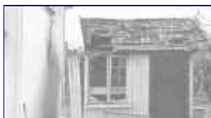
Skade på hus i Skolegaten nr. 13

angsten og avskyen for regimet seg gjeldende, og de følelsene varte helt til krigen var slutt.