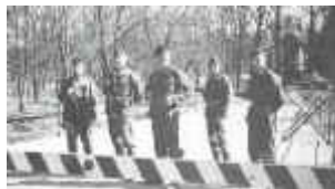
Tyske vakter ved Kanalbroen

"tyskerhær" av og til og gikk på ei rekke og sang "Hai li, hai lå".