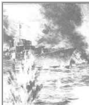
Mineleggeren "Olav Tryggvason" tar opp kampen mot den tyske krigsmarine på Horten havn om morgenen 9. april. "R17" blir skutt i brann og detonerer, også "R27" blir senket.

Hvor KNM "Heimdal" befant seg høsten 1939, husker jeg ikke, men den 9. april 1940 var den i farvannene omkring Tromsø. Den historien kjenner vel de fleste av oss, så den tar jeg ikke opp her. Men vi som var i Borre og Horten, husker nok denne datoen, vil jeg tro. Vi våknet tidlig om morgenen av vedvarende, kraftig kanonskyting. Det må nok har vært skuddvekslingen mellom tyske krigsskip ute i fjorden, og norske marinefartøyer som lå på Indre havn, for der hadde så vidt jeg vet en tysk "Raumboot" kommet seg innenfor Vealøs, og den ble senket av mineleggeren "Olav Tryggvason", som var en av de få nyere båtene som marinen hadde da. Nokså tidlig på dagen fikk vi så høre om "Blücher" som var blitt senket i Drøbaksundet, og om de norske, gamle panserskipene "Norge" og "Eidsvoll", som var blitt senket på havnen i Narvik. Dette var jo store tragedier som utspant seg dette døgnet, det ble sorg i mange hjem da, hvor de hadde mistet en far eller bror.