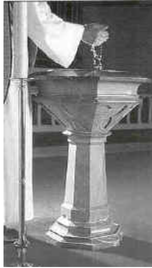
Døpefonten i kirken er av Nordlandsgranitt, og er utført av tukthusfanger fra "Slaveriet" på Akershus festning i Oslo