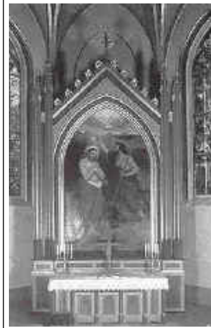
I 1868 kom den nåværende altertavle i kirken. Den fremstiller Kristi dåp i Jordan-elven, og er laget av Carl Julius Lorch.