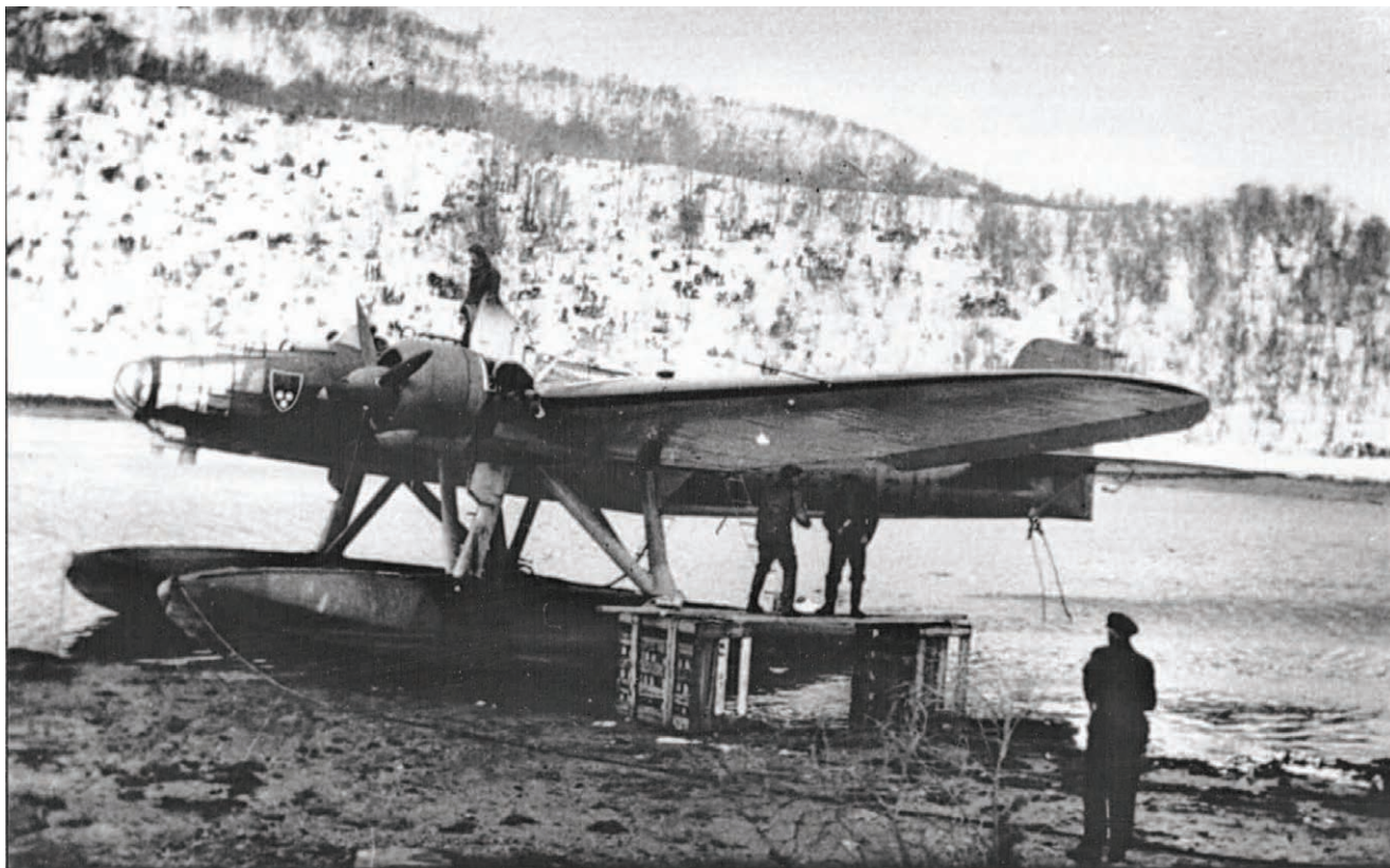
De tyske kjennetegn blir her malt over av medlemmer av vaktlaget.