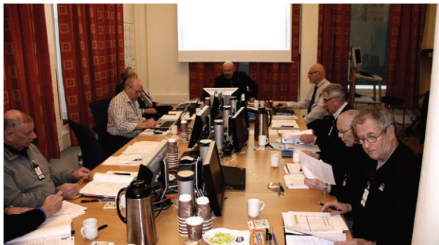
Landsstyret i arbeid

våre pensjonsutbetalinger undergier en årlig underregulering i forhold til lønnsutviklingen, og at diverse kreative tiltak på skatte- og avgifts-siden i statsbudsjettet også er med å inndra kjøpekraft fra statspensjonistene (Det vises til egen uttalelse i saken anledning).