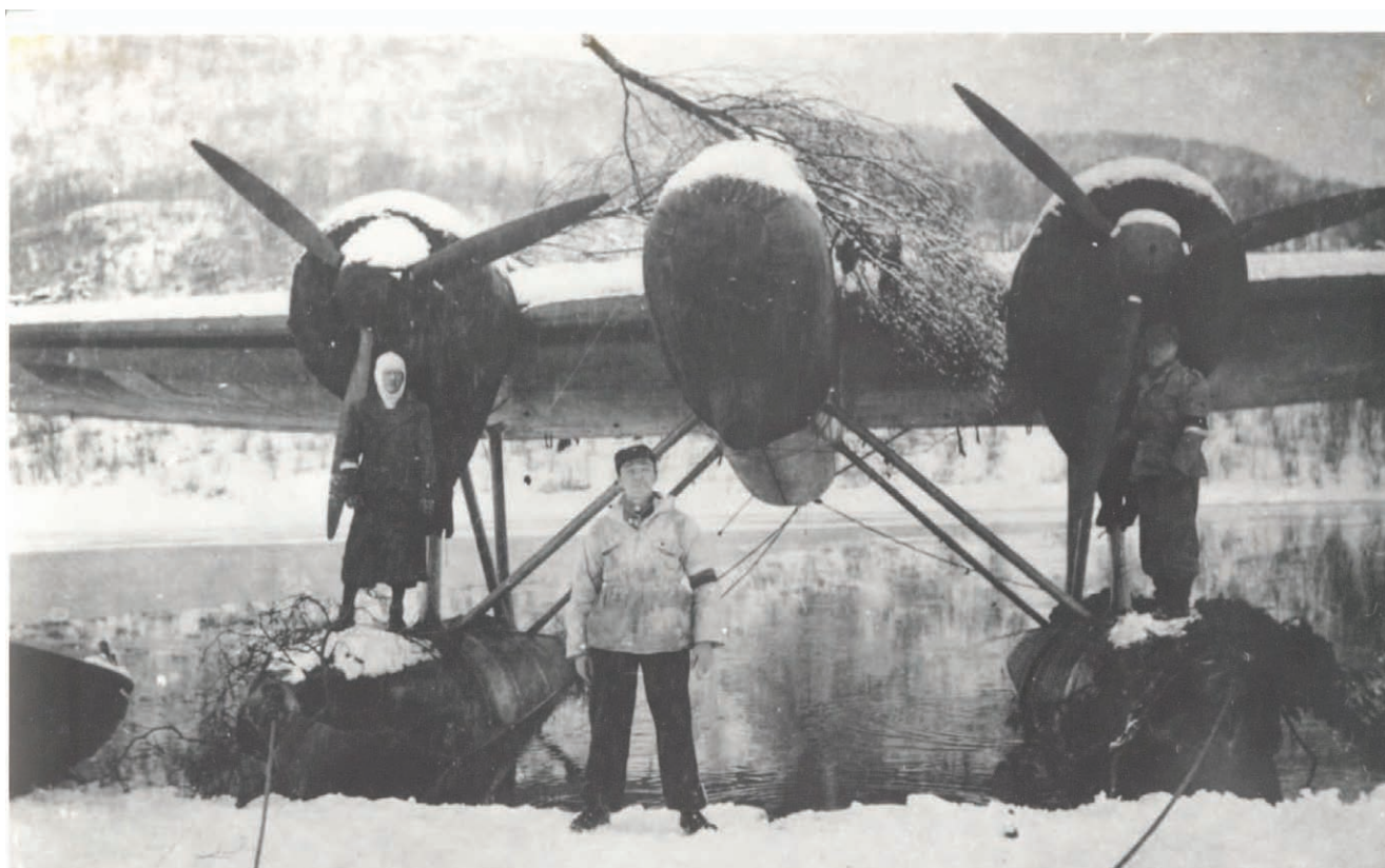
Det tyske flyet kamouflert i påvente av at det blir hentet opp til Skattøra