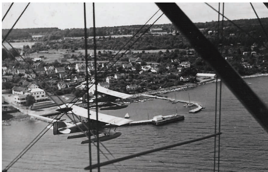
Øvelsesflyging med MF 11 over Åsgårdstrand 1933.

utnevnt til vernepliktig underoffiser (kvartermester). Ett av kravene ved opptak var at en forpliktet seg til fire årlige repetisjonsøvelser, hver på 40 dager, etter avsluttet utdanning. Full gjennomføring av dette programmet ledet normalt fram til løytnants grad.