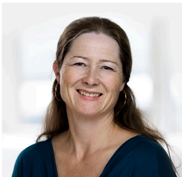
Leder for Rettsinfo.no/Jusbiblioteket. Mysen var bibliotekar i Wiersholm fra 1999 til 2018.

GLEMT RETTSKILDE-BASE: I koronaåret 2020 eksploderte bruken av Nasjonalbiblioteket med 41 prosent. Mange av dem var nok jurister.