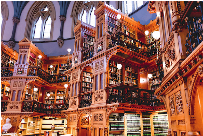
KJENN DITT BIBLIOTEK: Det blir lettere å finne, når du vet litt mer om bibliotekene du søker i, skriver Mysen. Illustrasjonsfoto fra biblioteket til Canadas parlament i Ottawa.

Nasjonalbiblioteket, Juridika, Lovdata Pro og Rettsdata. På denne måten får du utnyttet Nasjonalbibliotekets ressurser bedre. I tillegg registreres publikasjoner som bare ligger på ulike utgivere og foreningers hjemmesider. Dette er også materiale som Oria ikke alltid fanger opp, men som er viktig for jurister som vil arbeide digitalt og finne det lille ekstra som motparten kanskje ikke finner.